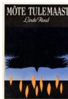
Mõte Tulemaast (1989)