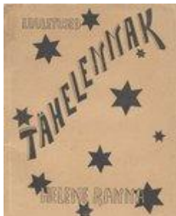
Luuletuskogu „Täheleennak“ (Tartu, 1935)

Romaan „ Riidalu “ (Tartu, 1936) süžeeks on kahe venna leppimatu võitlus isalt päritud talumaade pärast. See on järg romaanile „Keha ja vaim“, kuid teos kaldub liigselt filosoofiasse.